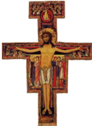
Het kruis van San Damiano.

De heilige Geest geeft hem het inzicht dat alles wat God geschapen heeft bij elkaar hoort en dat je daar goed voor moet zorgen. Zo wordt hij niet alleen de vriend van mensen, maar van alles wat God geschapen heeft. Daarom wordt zijn feestdag uitgeroepen tot Werelddierendag. Hij sterft op 3 oktober in 1226. Twee jaar later wordt hij heilig verklaard.